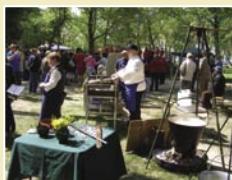
Móri Szent György Heti Vigasságok Április 24 - május 1.