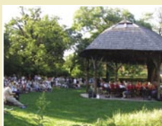
Nyári Zenei Estek Június 20 - augusztus 29. vasárnaponként 18 órától