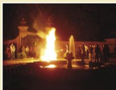
Múzeumok Éjszakája Június 19.